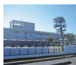
鏡が沖中学校 徒歩8分 約580m