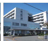
総合医療センター 車で4分 約2700m