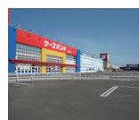
コマタウン 車で3分 約1200m