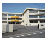
枇杷島小学校 徒歩11分 約870m