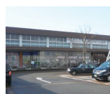
柏崎駅南口 徒歩14分 約1100m